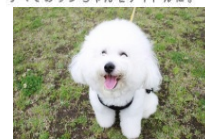
ホリプロアイドルドッグ.jp