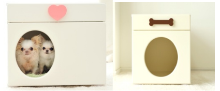
横置きタイプ ¥29,500(税込み) 縦置きタイプ ¥28,500(税込み)

<参考URL> http://wan-chan.jp/prom/araki-report-vol9/index.html